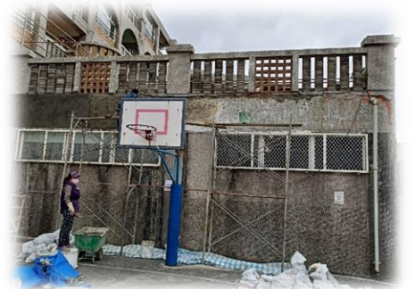
協助學校斜坡復原