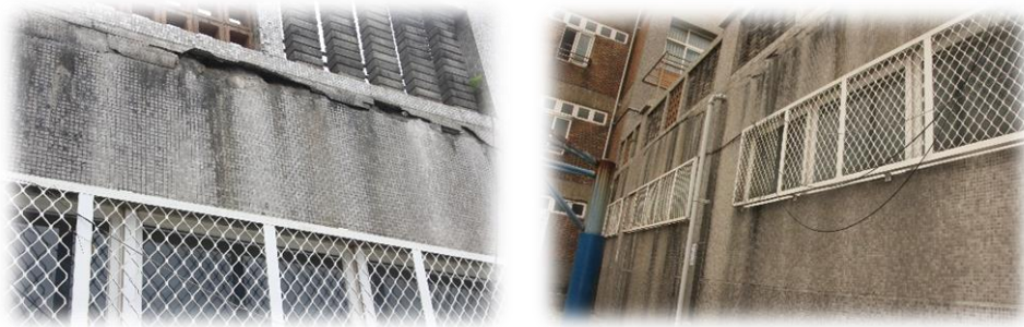
外牆鋼筋外露及石塊脫落