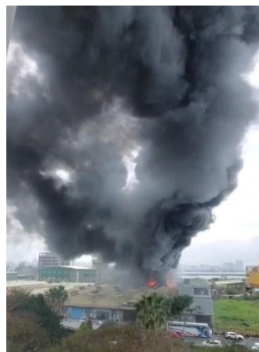
112. 2. 23 鄰近輪胎行失火，濃煙四起，空污嚴重