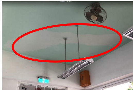
四樓圖書館、綜合教室及情境教室天花板打入發泡劑防止漏水