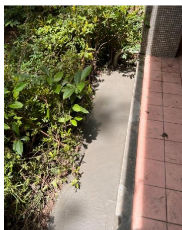
發現漏水由此處破洞而入