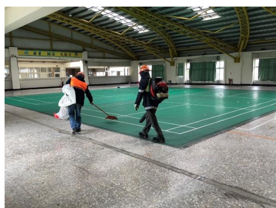
2. 24 長官視察及進行初步復原清潔工作