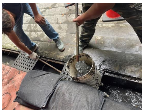
專業清淤（含廢氣物運除）