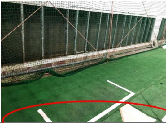
腹壁滲水，造成場地溼滑