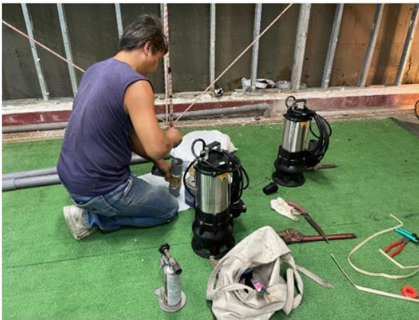
三相馬達更新照片