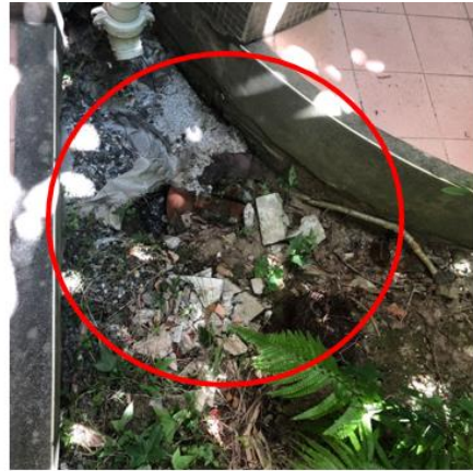
學務處前落水口，大雨排水直接沖刷土壤造成地下室腹壁漏水 (計2處)。