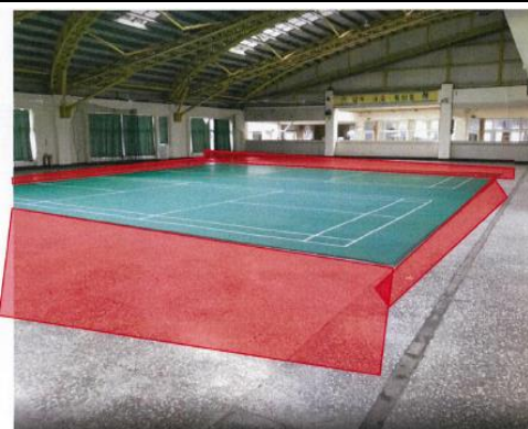
將增設擴大運動地墊及一面躲避球場劃線