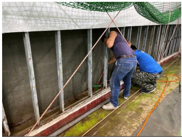
清淤及量測擋水板工程