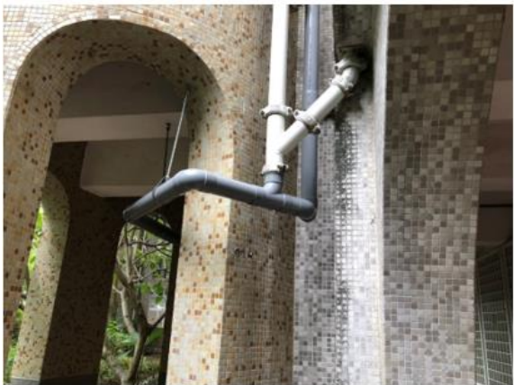
排水管修改及延伸