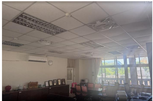
校史室及校長室已全面更新崁入式風扇（114.5.10 完工）