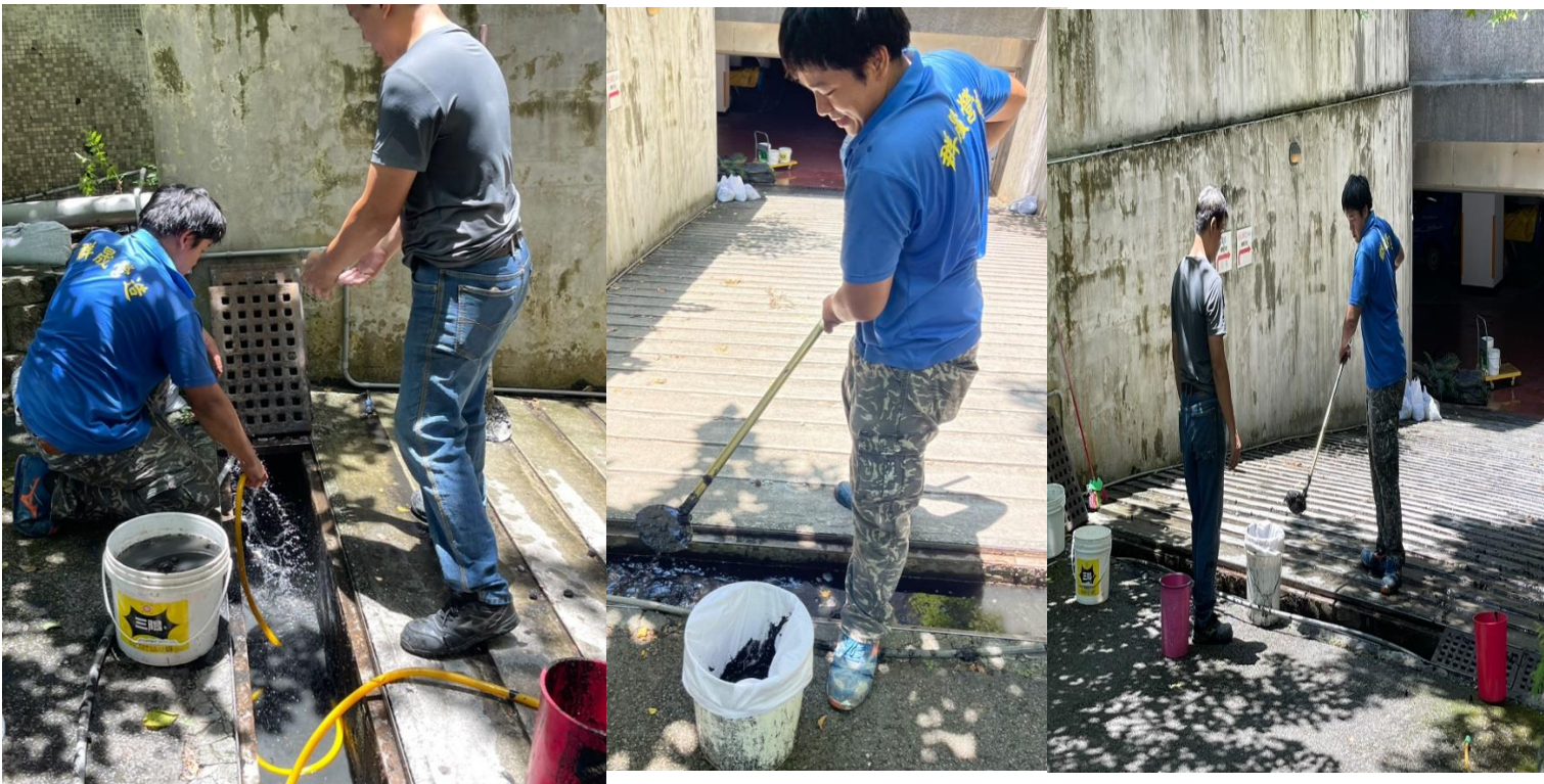
地下室停車場清淤，改善雨季容易積水問題（114.6.26 完工）