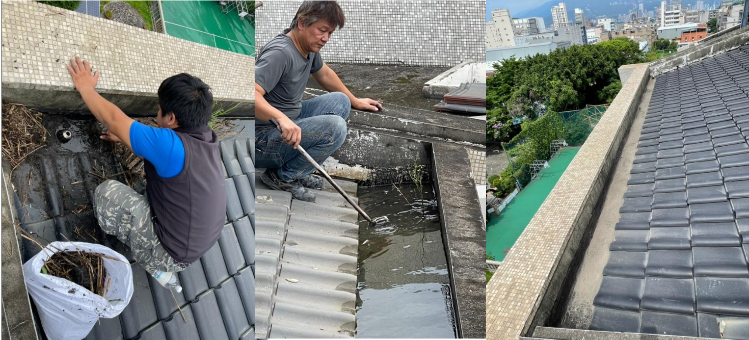
屋頂兩側天溝清除雜草及淤泥，改善班級漏水問題