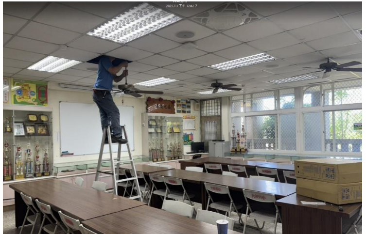
全面更新崁入式風扇安裝