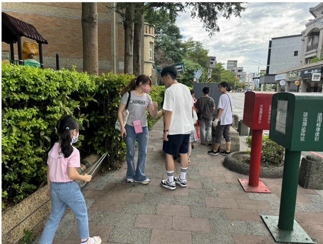
公車站旁清潔乾淨，等候公車好心情