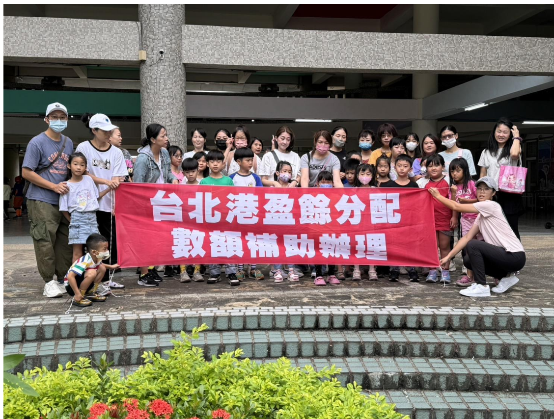
感謝區公所補助經費