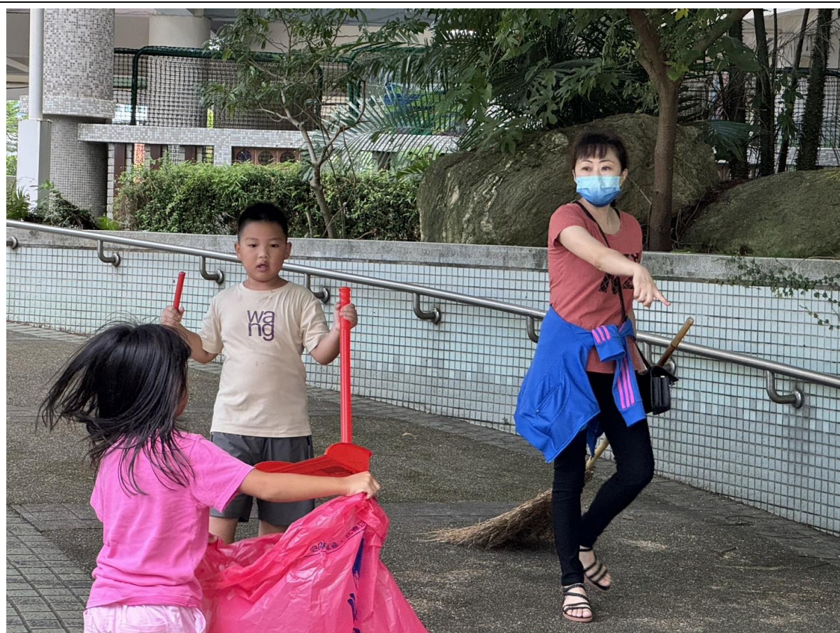
透過社區服務，增進親子教育