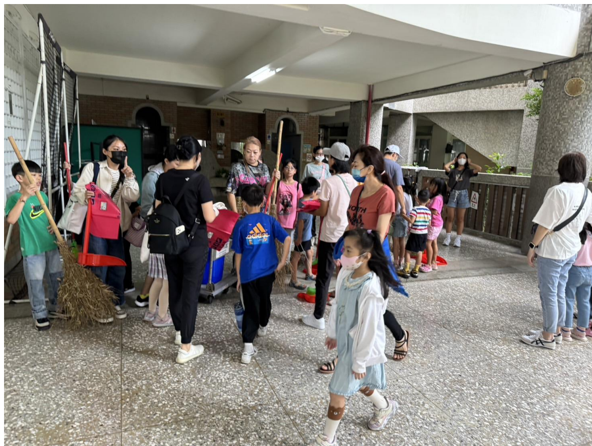
承辦人說明後，開始清潔活動