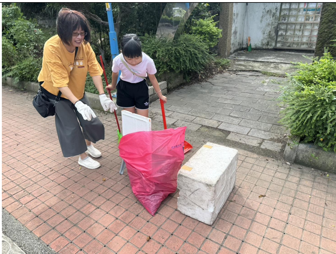
北河公園也清掃乾淨了！