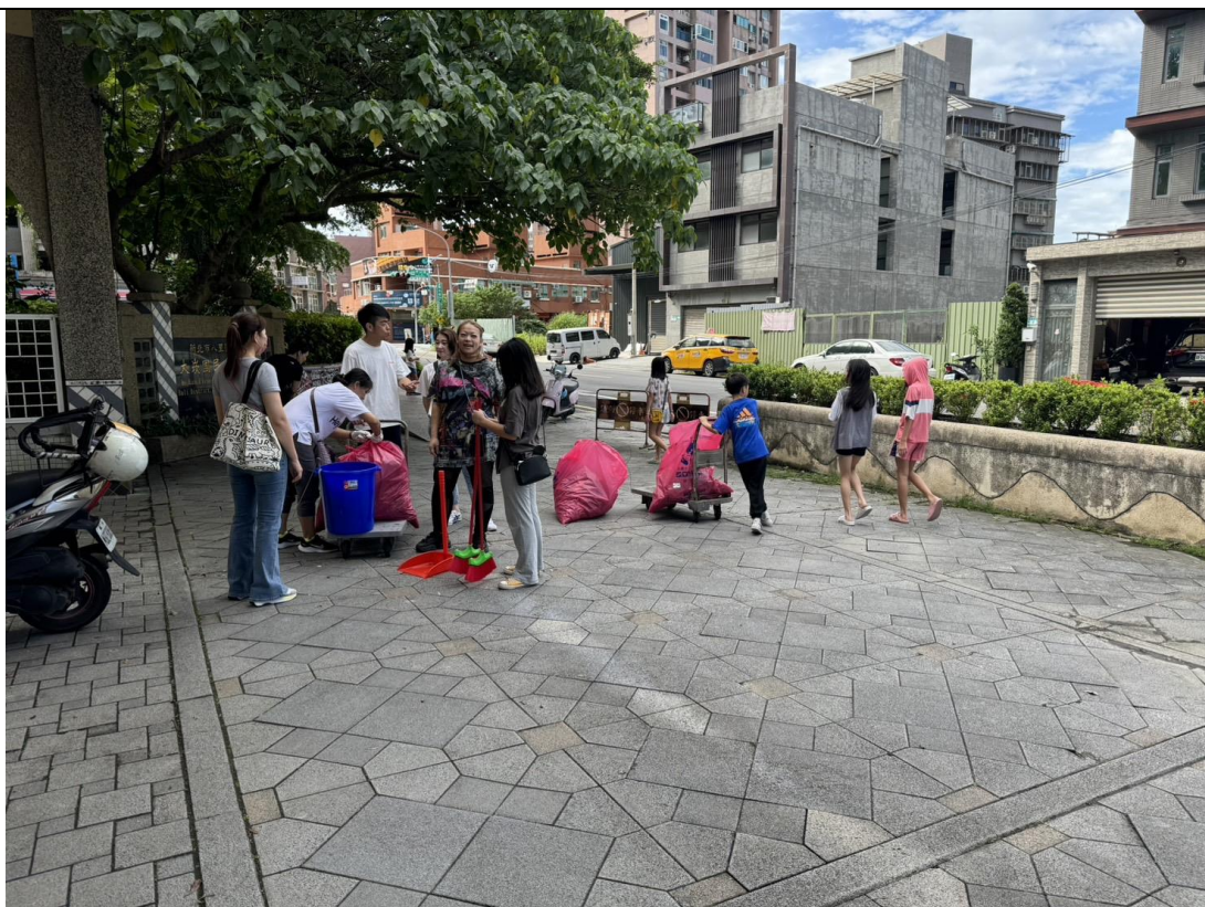
大家彼此交流，共享親子有趣話題