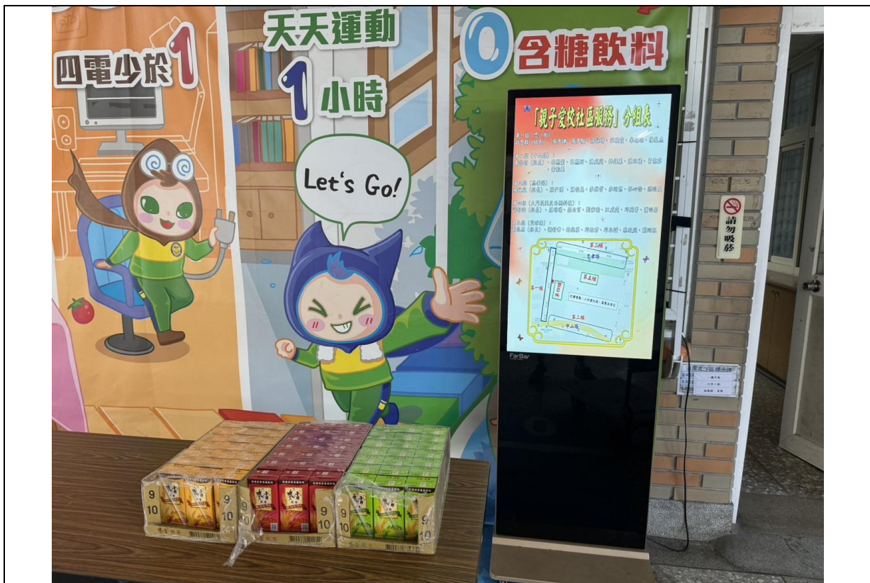
參與人員分組及公告