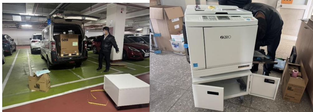
新型快刷印刷機採購到貨