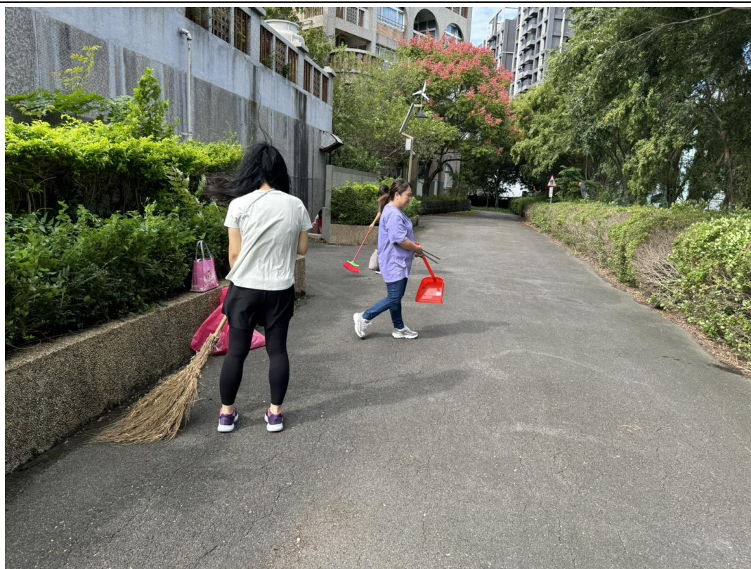
活動結束，領取服務時數、西點餐盒及飲料，開心合照