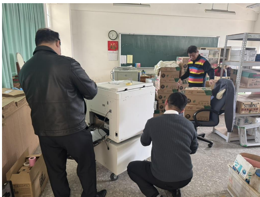
人員安裝及教授使用