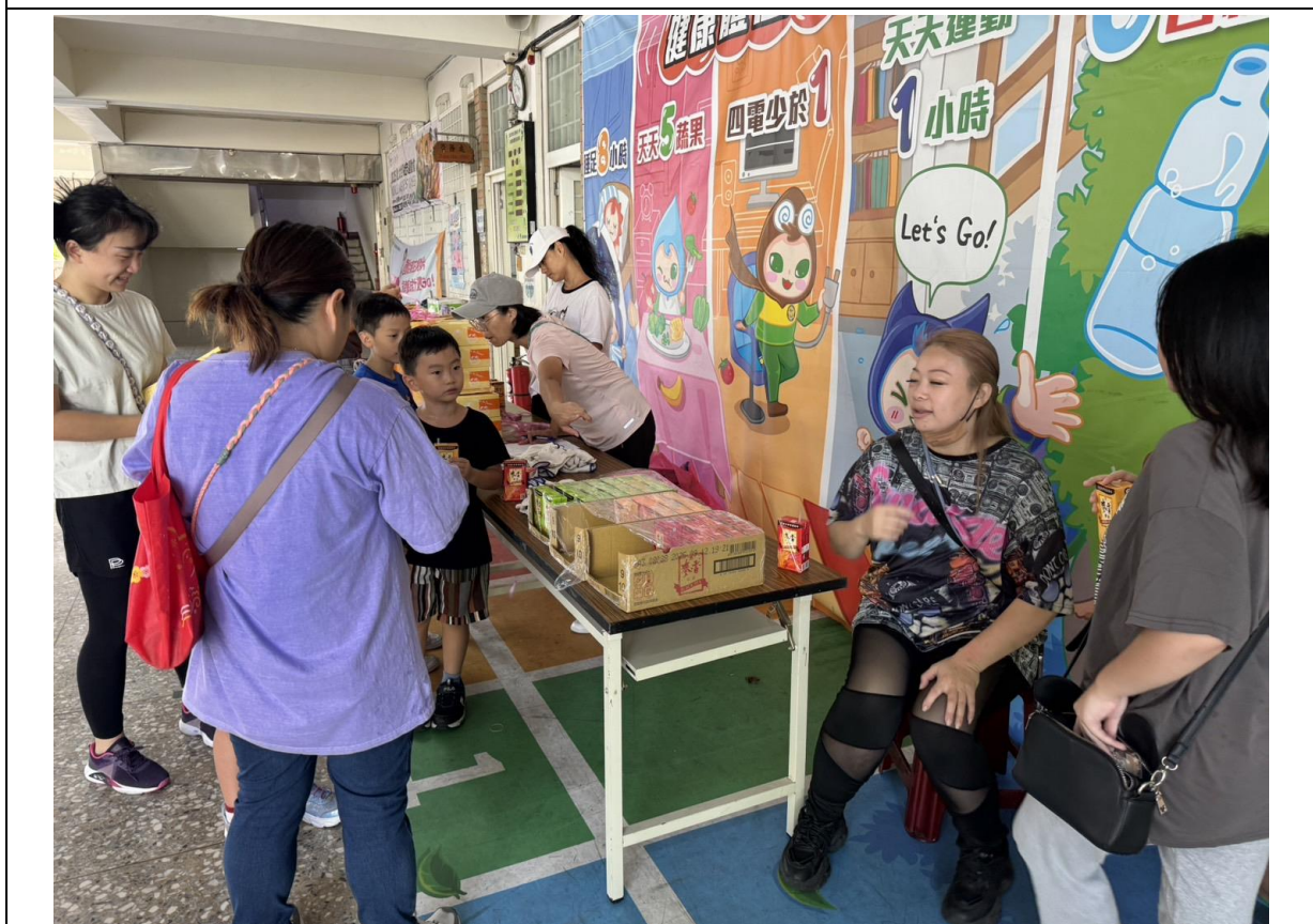
參與人員陸續報到中