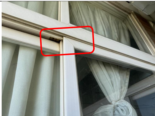
部份下緣窗戶需加裝固定條