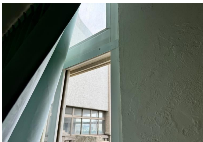
教室內側-施作完成