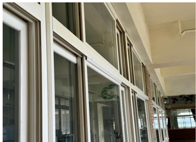
走廊外側-施作完成