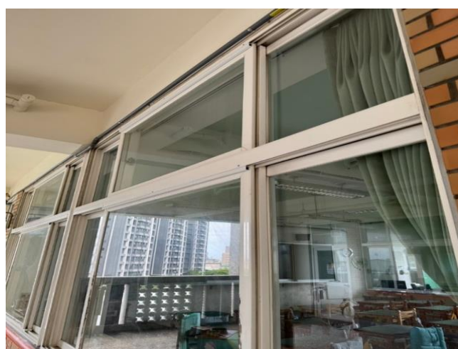
走廊外側-施作完成