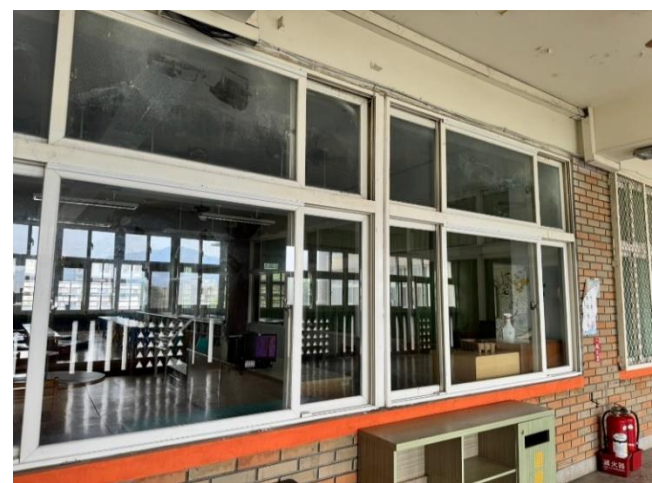
走廊外側-施作完成