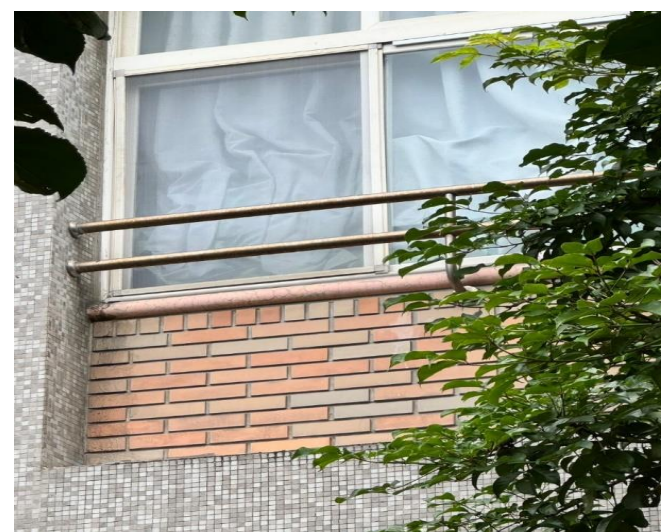
外側(紗窗)-施作完成