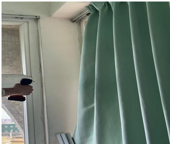
教室內側-鋁平條鎖固