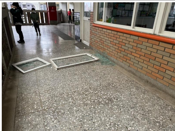
113.3.1 學生攀爬窗戶，造成上成氣窗掉落