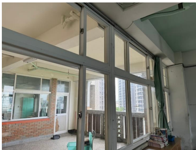
教室內側-施作完成