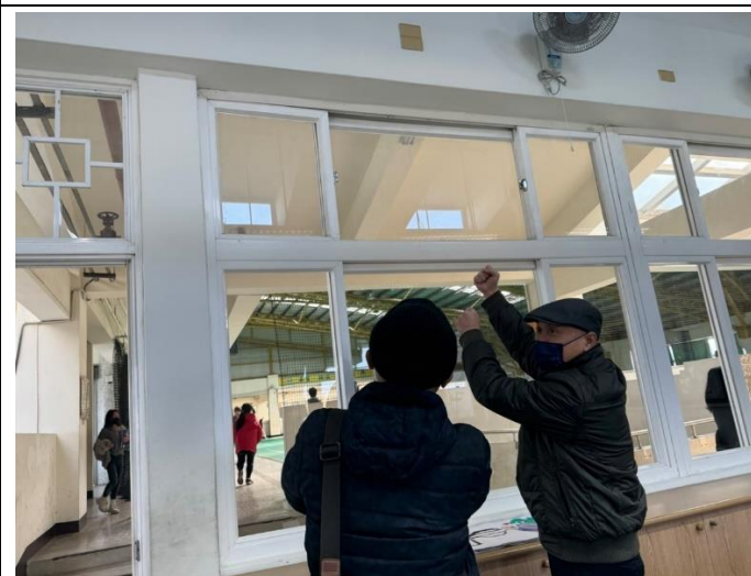
一檯氣窗玻璃由三面玻璃組成（1大固定，2小活動）