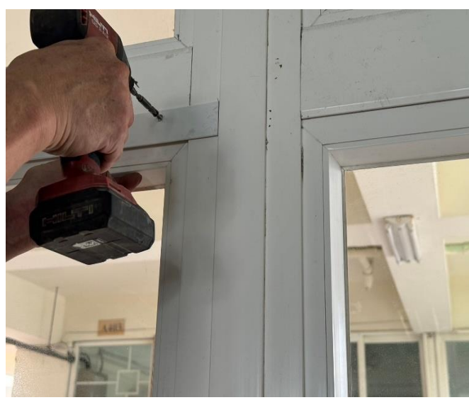
教室內側-鋁平條鎖固