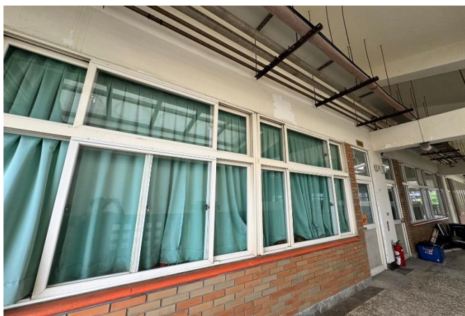
走廊外側-施作完成