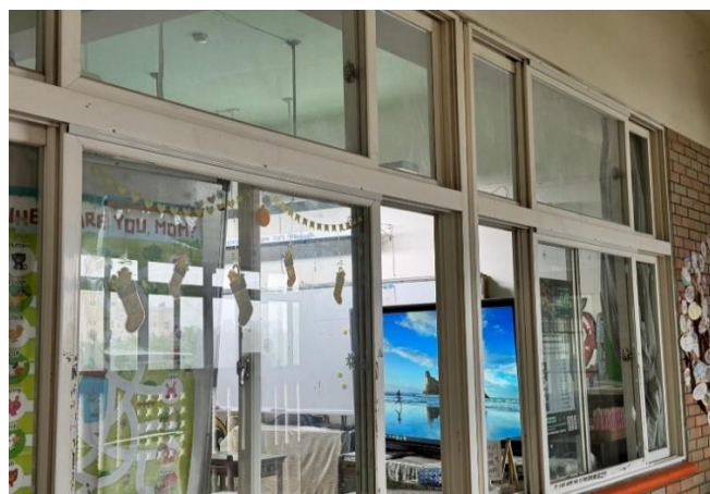
走廊外側-施作完成